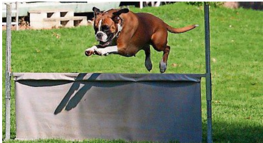
Familien- und Sporthund: Boxer beim Sprung.

Der Deutsche Boxer ist ein wundervoller Familien- und Sporthund sowie ein fröhlicher und treuer Begleiter. Er hat starke Nerven, eine grosse innere Sicherheit und ist deshalb in allen Situationen äusserst belastbar. Weil er selbstbewusst ist, zeigt er oft einen Anflug von Dominanz. Seine Kinderliebe und Zuverlässigkeit sind sprichwörtlich. Die Anhänglichkeit seinem Menschen gegenüber und dem ganzen Familienrudel, aber auch seine Wachsamkeit und Unerschrockenheit, sind Teil seines ausgeprägten Schutzhundecharakters.